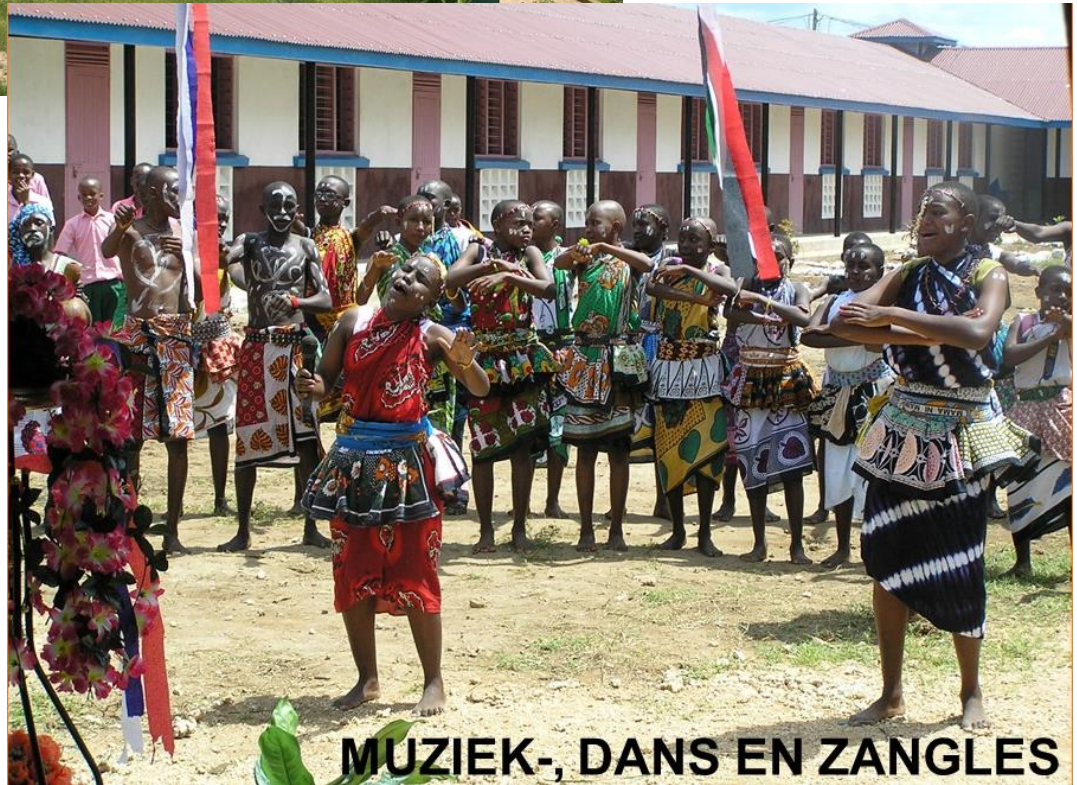
MUZIEK-, DANS EN ZANGLES